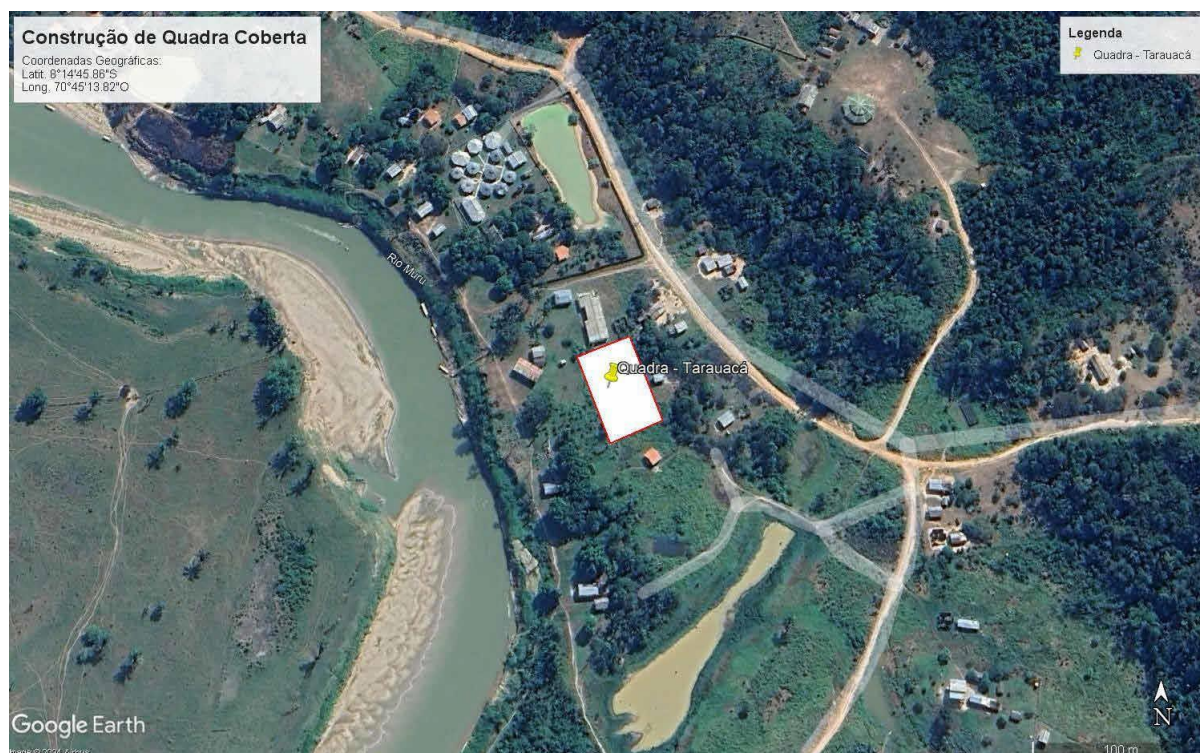
IMAGEM 01: Coordenadas: Latitude: 8°14'45.86"S Longitude: 70°45'13.82"O